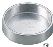
アルミダイキャスト 灰皿 シルバー