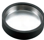
③ビート灰皿 小 (φ100) 丸型 (ゴム枠)