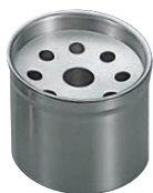
⑬18-8 筒型 灰皿 R3