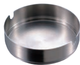
②18-8 スタック灰皿 (ヘアライン仕上)