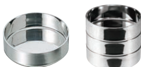
⑤18-8 シンプルトレイ (バターディッシュ兼用)