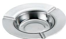
①EBM 18-0 平灰皿